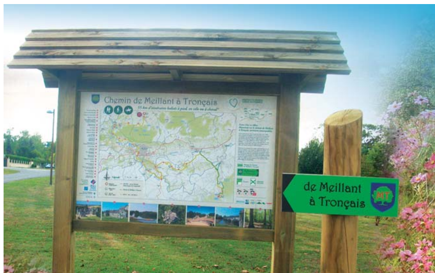
Installation de panneaux d'accueil à Meillant (Ici Espace des Chaumes) et à Tronçais. 530 Panneaux balisent le chemin de randonnée.

Exemple concret du maillage de notre territoire et véritable colonne vertébrale verte, ce chemin vous permettra une itinérance douce et agréable.