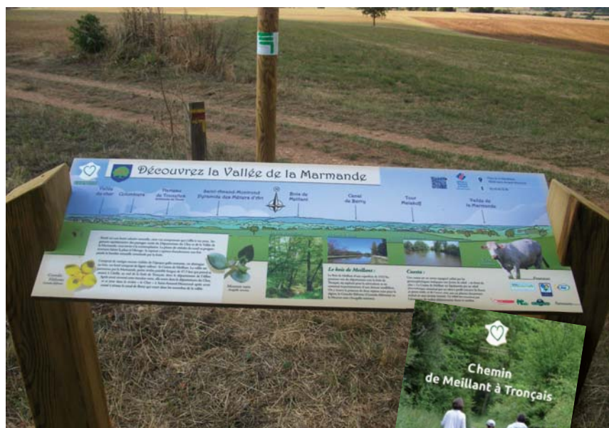
La table de lecture à Coust pour s'orienter et s'informer.